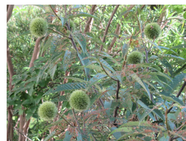
【学校の秋、見つけた】

さて2学期がスタートしました。2学期は「学びの定着」を図る大切な時期です。個人懇談で「お子さんのよりよい成長に向けて」話し合ったことをもとに2学期も職員一丸となって頑張ります。ご協力・ご支援をよろしくお願いします。