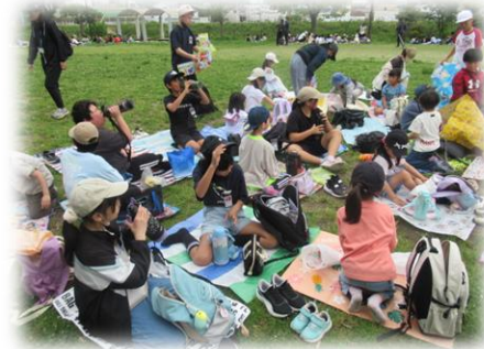
【4/28 (火) 歓迎遠足】