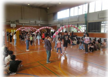
【4/28 (火) 歓迎集会】