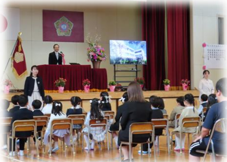
【4/10 (金) 入学式】

子ども達がわくわくして登校し、笑顔で下校できる学校を目指し、「すすんでかかわる」「すすんでまなぶ」「すすんでうごく」を合言葉に、職員一同、全力で取り組んでまいります。