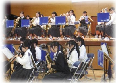
【平野中学校吹奏楽部の演奏】

お昼にはお弁当と、お祝いのミニケーキを食べ、午後からは、天候が心配されましたが、運動場でバルーンリリースを行うことができました。風船が空に飛んでいくと子供たちから大きな歓声があがりました。お祝いムードに包まれ、心に残る1日となりました。お手伝いいただいた保護者の皆様、本当にありがとうございました。