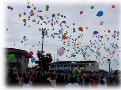
【バルーンリリース】