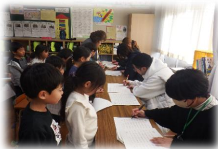
【「花まる先生」に丸付けをしていただく子供たち】

12月16日 ボランティアの方による読み聞かせがありました。ハンドベルの演奏や本の読み聞かせ等、子供たちがとても楽しんでいました。ボランティアの皆様、ありがとうございました。