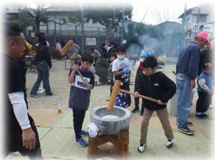
【餅つきをする子供たち】

12月9, 11, 12日 「花まる先生」(学習支援)では、計算問題の採点など多くの保護者の皆様に御協力いただきました。子供たちがたくさんの問題に挑戦することができました。