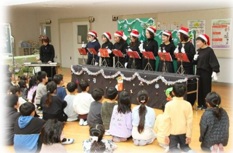
【クリスマスお話会の様子】

昨年12月にも、地域・PTAの皆様方に本校の教育活動に御理解・御協力いただきました。誠にありがとうございました。子供たちが月の浦小学校に安心して通うことができるのは、地域・PTAの皆様方の御協力のおかげです。