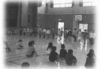
【4/28 1年生の歓迎集会の様子】

毎朝のお子様の健康チェックをお願いします。配付しました「健康観察カード」に日付、体温、症状を記入して必ず押印をお願いします。カードはお子様を持たせて担任まで提出してください。