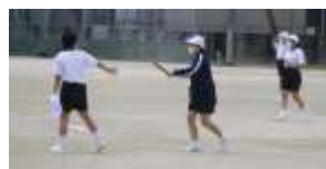
授業でのバトンパスの練習

5月16日(日)に第75回体育祭が予定されていましたが、福岡県に緊急事態宣言が発出され、体育祭を延期することになりました。まだ、新型コロナウイルス感染症は予断を許さない状況ですので、6月20日まで延長されました。緊急事態宣言下では、感染拡大防止のために学校行事を自粛するように要請されています。このことを受け、大野城市の5校では延期されています体育祭を緊急事態宣言解除後に実施いたします。先日配付いたしましたとおり、6月25日(金)に各学年の競技時間をずらしたり、時間を短縮したりするなど、工夫して実施することとしました。