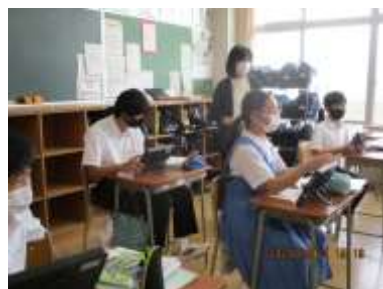
タブレットを使用した授業

「1人1台端末と、高速大容量の通信ネットワークを一体的に整備することで、特別な支援を必要とする子供を含め、多様な子供たちを誰一人取り残すことなく、公正に個別最適化され、資質・能力が一層確実に育成できる教育環境を実現する」として文部科学省はギガスクール構想を立てています。これを受け、大野城市でも児童生徒に一人一台ずつタブレットを使用できるように環境を整備しています。本校でも、タブレットを使った授業を始めたところで、タブレットを使用することで視覚化でき、級友がどんなことを考えているのか、自分の考えと比較をしやすくなりました。また、新型コロナウイルス感染症が収束せず、いつ臨時休校にならないとは限らないこの時期、オンラインでの授業等を可能にできるタブレットを使用できることは、とても有意義なことであると感じています。