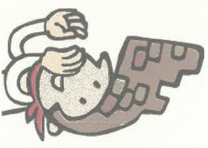
大野城市PRキャラクター 大野ジョー

大野東中のみんなはもちろん、他校のみんなも、たくさん食べてくれると うれしいです! 次は、どの学校の生徒考案メニューかな?