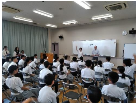
キャリアアップ講座