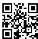
PECOFREE カスタマーサポート

※利用方法などは、PECOFREE カスタマーサポート、または PECOFREE の友だち登録後、LINE でも問い合わせができます。