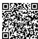
PECOFREE 操作方法 (PDF)

大野城市教育委員会 教育政策課教育政策担当 TEL : 092-580-1902 (直通)